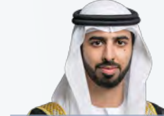
معالي عمر سلطان العلماء عضو مجلس الإدارة