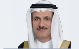
معالي سلطان بن سعيد محمد المنصوري رئيس مجلس الإدارة