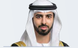
معالي عمر سلطان العلماء رئيس مجلس الإدارة