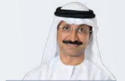
سعادة سلطان أحمد بن سليم رئيس مجلس الإدارة